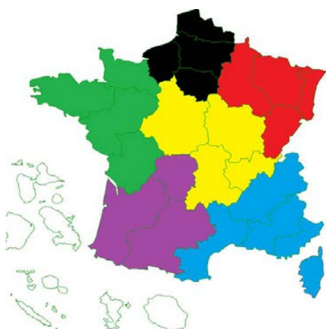
Carte des zones actuelles